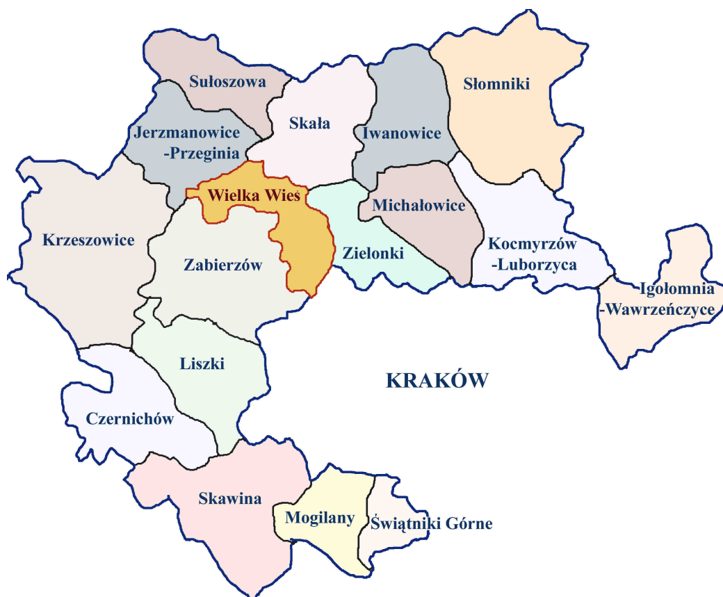
Rys. nr 1 Mapa Powiatu krakowskiego.

Graniczy od południa z gminą Kraków, od północy z gminami Jerzmanowice - Przegonia i Skała, zachodu – Zabierzów i Krzeszowice, wschodu – gminą Zielonki (Rys.1).